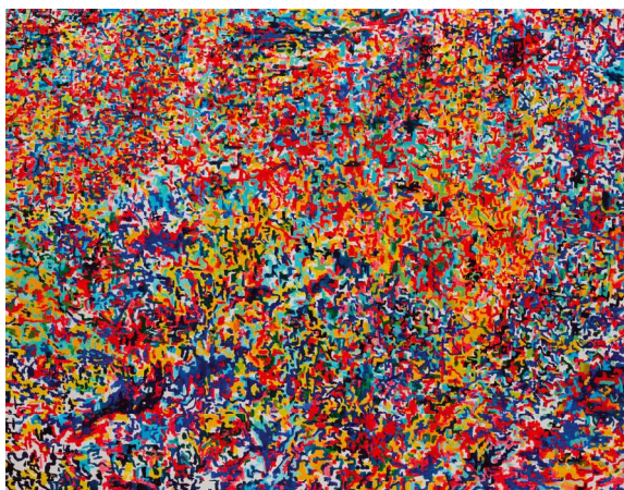
Martin Čada, Krajina V , 2009, akryl a olej, plátno, 110 x 140 cm

Velký formát obrazu pokrytý zlatou barvou s názvem „Krajina I“ Martina Čady z roku 2007, jehož plocha je narušena takřka neviditelnou, řídkou sítí několika, většinou horizontálních čar na sebe kdekoli nutně strhne pozornost poučeného i zcela neznalého diváka. Ten obraz se na první pohled jeví v souvislostech současného českého, chtělo by se říci většinového výtvarného projevu jako troufalost. Když pomíneme v českém prostředí dnes tak běžné znevažování obrazu a malby, pak je také troufalé použití minimalistického, konceptuálního zásahu do jednolitě zlaté plochy. Naposledy ve středověku bylo zlato v obraze znamením nekonečna, znamením věčnosti, a tedy nejzazšího bytí, znamením boží přítomnosti. Je tedy velkou odvahou pokusit se zlaté ploše, a vlastně tím i obrazu, znovu dát možnost být takovým znamením. Obraz „Krajina I“, a nejen on, jak ještě uvidíme, je také demonstrací odvahy, s jakou Martin Čada přistupuje k malbě, k obrazu, ke zkoumání jeho možností i zkoumání svého vlastního talentu, naladění a směřování.