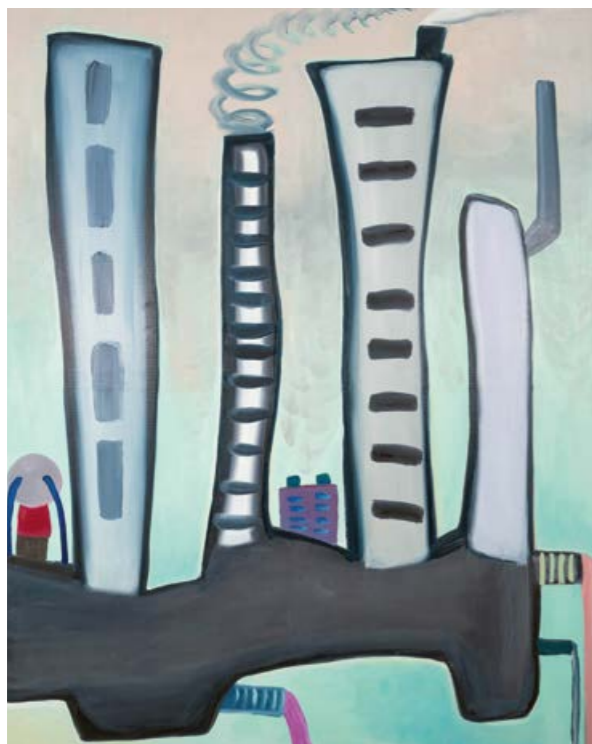
Martin Čada, Cyklus Plačící , 2005, olej, plátno, 180×145 cm