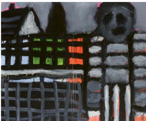
Martin Čada, Před bouřkou - Permeke, 2015, inkoust, akryl, olej, plát- no, 145×180 cm