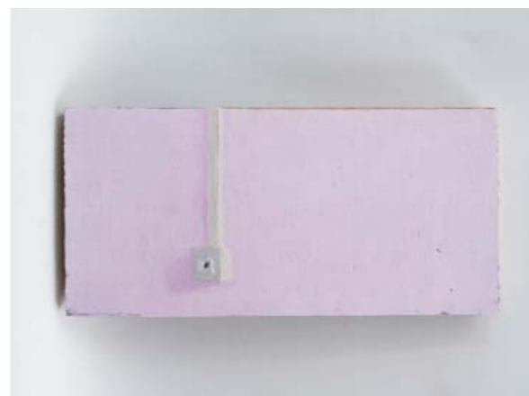
Martin Čada, Vypínač , 2002, olej, dřevo, 12×25 cm