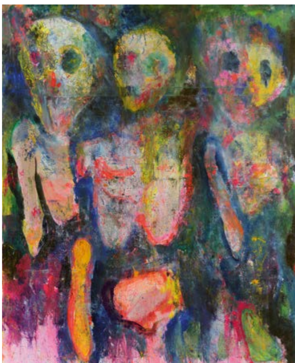
Martin Čada, Průvod I, 2015, inkoust, akryl, olej, plát- no, 180×145 cm