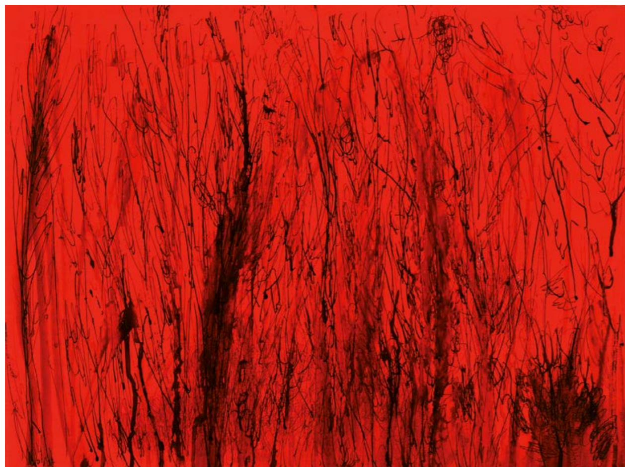
Martin Čada, Trávy I , 2010, akryl, propiska, tuš, plátno, 50×70 cm