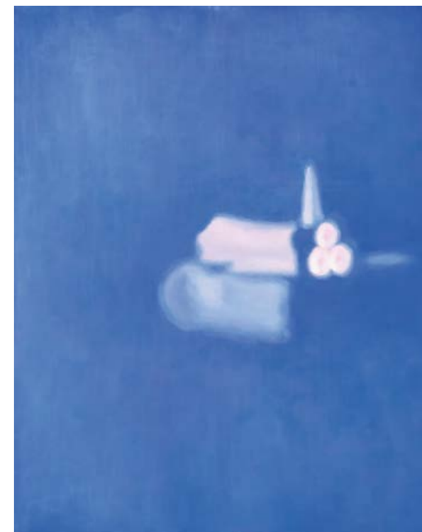
Martin Čada, Raketoplán , 2001, olej, plátno, 160×125 cm