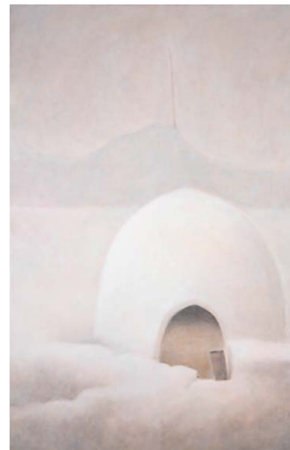
Martin Čada, Iglú , 2002, olej, plátno, 175×130 cm